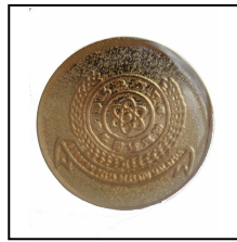
徽章 Badge RM5.00