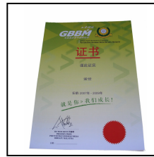
证书 Certificate RM2.00

备注：必需呈上证书接受者之中文与英文姓名、职称 Remark: Must attach Chinese and English Name & Position of the certificate holder