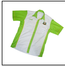
工作服 Baju Kerja S, M, L, XL RM50.00