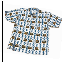
巴迪团服 Batik M, L, XL, XXL RM30.00