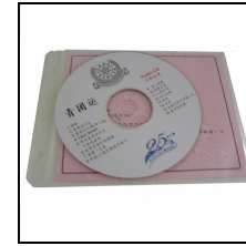
唱碟 CD RM10.00