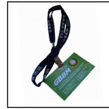
颈带 Lanyard RM2.00