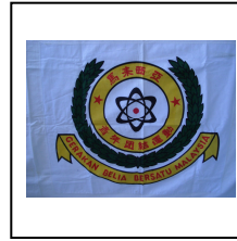
团旗 Flag RM20.00